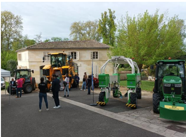
Matériels agricoles exposés lors du festival du 28 avril

Plus de renseignements au 05.46.48.58.10