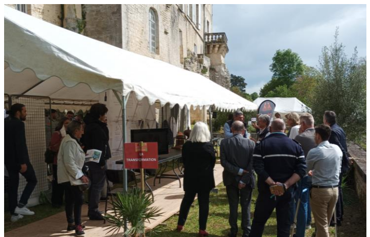
Inauguration du festival avec les élus et partenaires